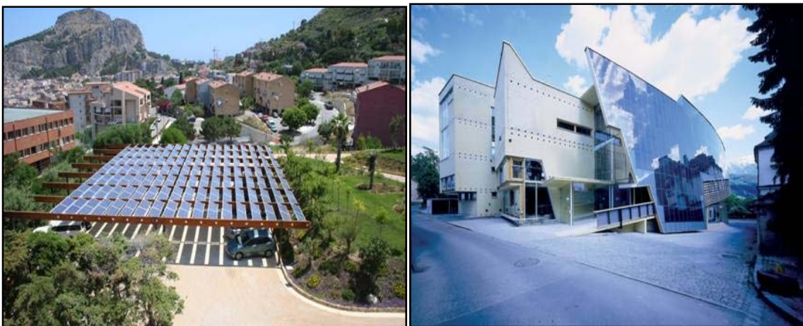
Figura 2.c - Impianti di produzione fotovoltaica totalmente integrati