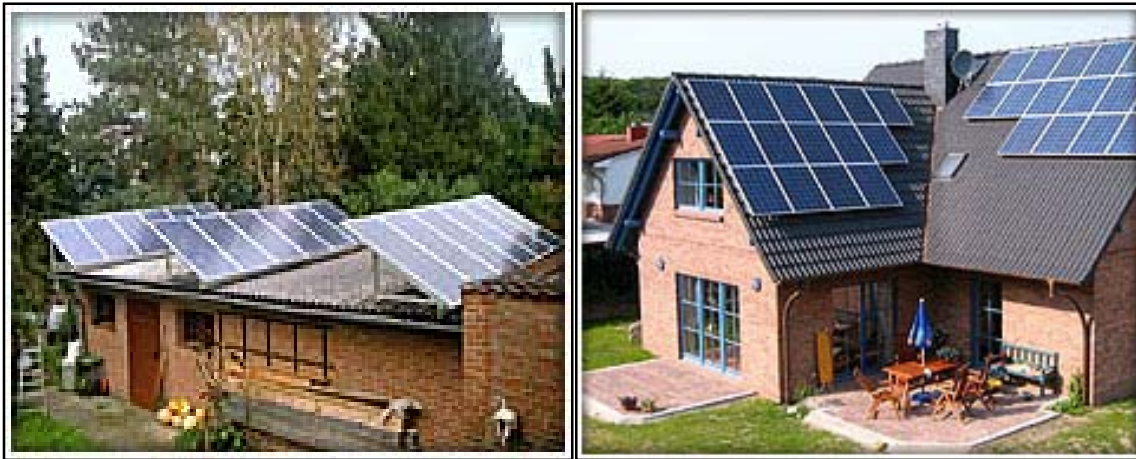
Figura 2.b - Impianti di produzione fotovoltaica parzialmente integrati