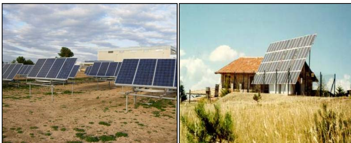
Figura 2.a - Impianti di produzione fotovoltaica non integrati

Ai sensi dell'articolo 2, comma 144, tabella 2 e comma 145, tabella 3 della Legge Finanziaria 2008, nonché dell'articolo 3, commi 1 e 2 del DM 18/12/2008, la produzione derivante da impianti fotovoltaici non può accedere alla incentivazione mediante certificati verdi o tariffa onnicomprensiva , ad eccezione di quella derivante da impianti per i quali sia stata inoltrata la domanda di autorizzazione unica di cui all'articolo 12 del decreto legislativo 387/03 ovvero la richiesta di autorizzazione prevista dalla vigente normativa nazionale o regionale, in data antecedente alla data di entrata in vigore della legge finanziaria 2008. Per tali impianti, infatti, è consentito l'accesso al meccanismo dei certificati verdi, applicando le disposizioni di cui al DM 24 ottobre 2005, nella versione vigente al 31 dicembre 2007, (art.15, comma 2 del DM 18 dicembre 2008). L'incentivazione della produzione fotovoltaica si ottiene pertanto in modo quasi esclusivo mediante il sistema del conto energia.